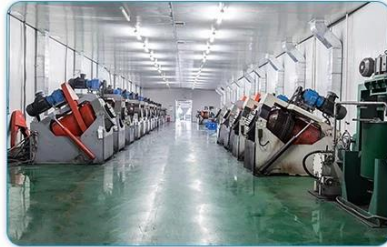
MIXING & GRINDING